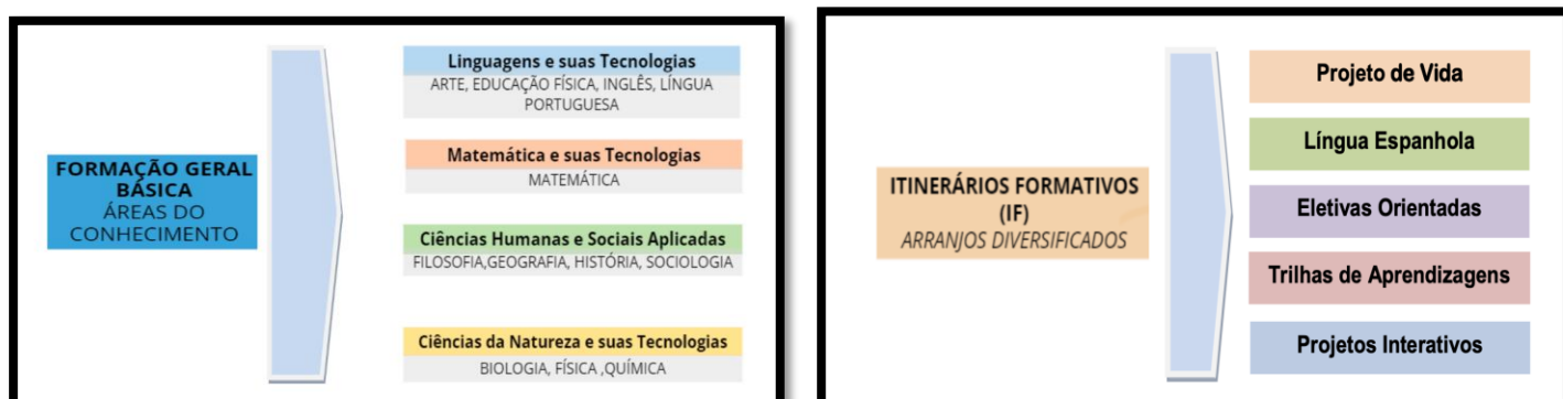
Figura 1 - Organização da Formação Geral Básica e Itinerários Formativos por Área de Conhecimento